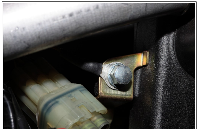
Abbildung 5: Masseanschluss des Kabelbaums.