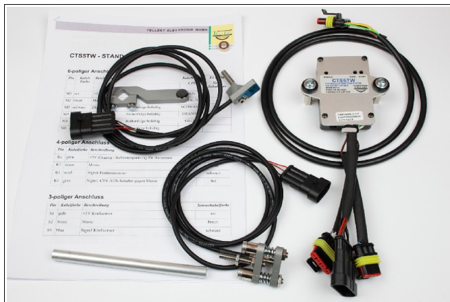
Abbildung 1: Lieferumfang.