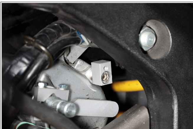
Abbildung 2: Halter für Positionssensor.