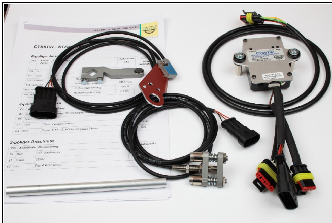
Abbildung 1: Lieferumfang.