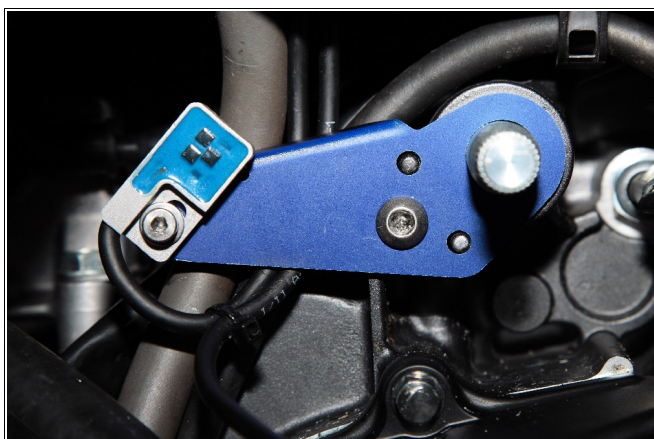
Abbildung 2: Halter für Positionssensor.