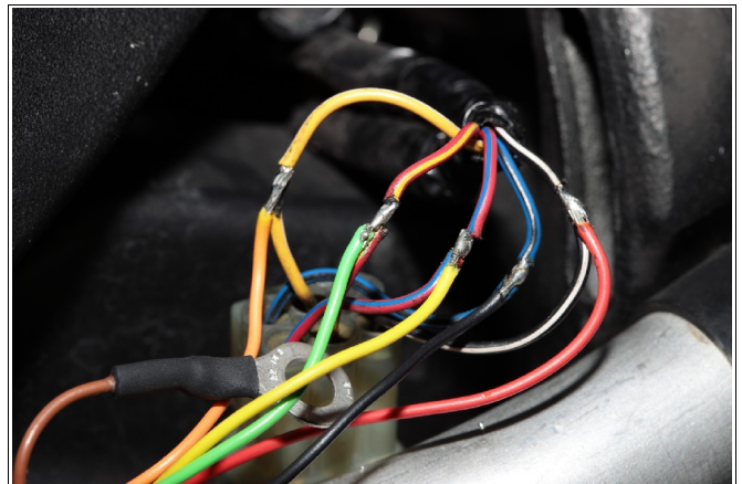
Abbildung 4: Anschluss des Kabelbaums (rechts neben der Airbox).