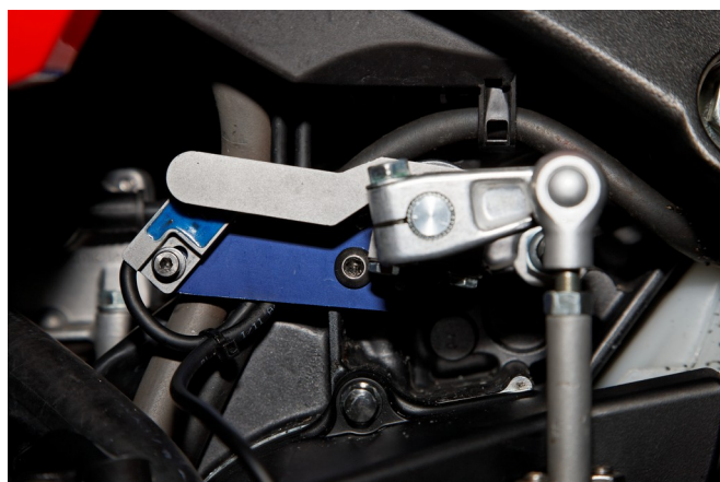
Abbildung 4: Position „Klaue auf Klaue“