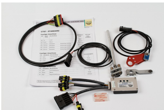
Abbildung 1: Lieferumfang.