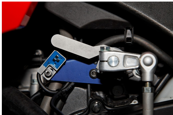
Abbildung 3: Ruhestellung des Magnethebels.