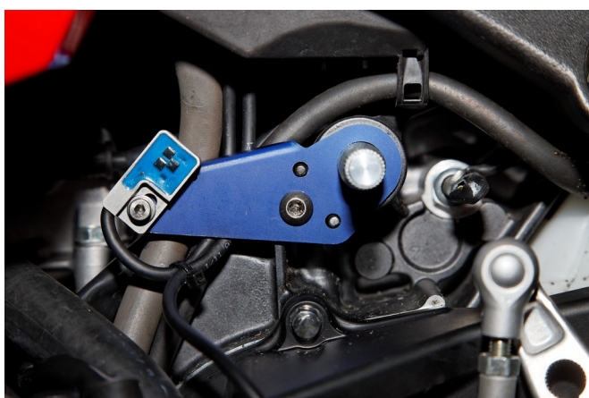
Abbildung 2: Halter für Positionssensor.