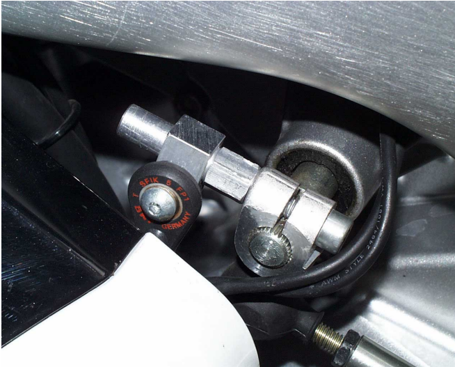
Figure 1: Upper attachment of reset sensor at control shaft.

Abbildung 1: Obere Befestigung des Reset-Sensors an der Schaltwelle.