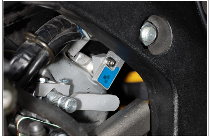
Abbildung 3: Ruhestellung des Magnethebels.