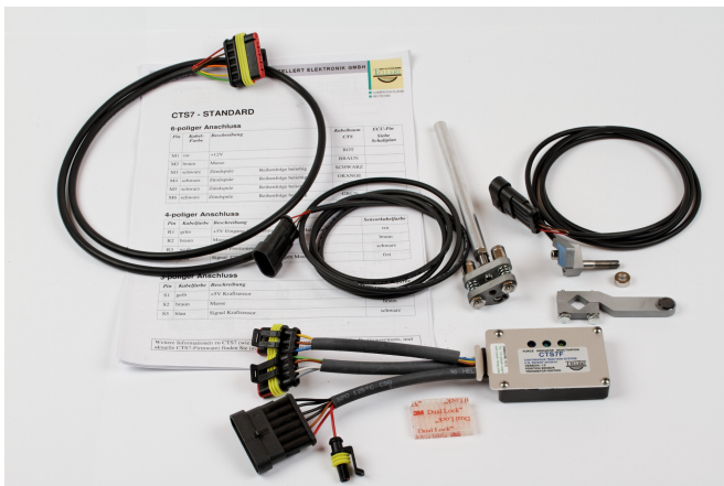
Abbildung 1: Lieferumfang.